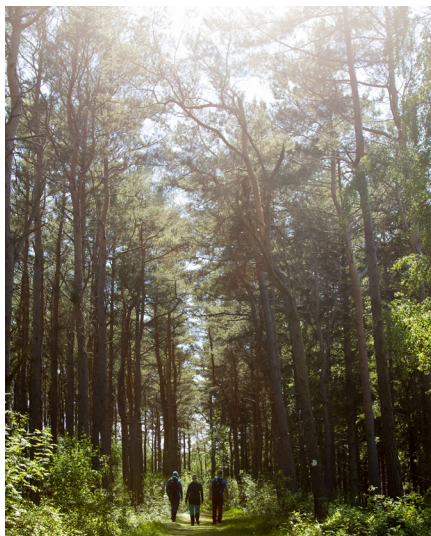
Skogsdungarna på Ramsviklandet består omväxlande av högresta tallar och lövskog.

På Ramsvik runt finns skog, öppna betesängar, släta röda granitklippor och geologiska sevärdheter. Vill du ha lite spänning kan du bestiga Sote Bonde som reser sig 58 meter över havet och bjuder på en vidunderlig utsikt över havsbandet utanför Ramsviklandet.