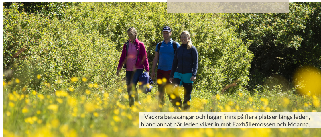
Vackra betesängar och hagar finns på flera platser längs leden, bland annat när leden viker in mot Faxhällmossen och Moarna.